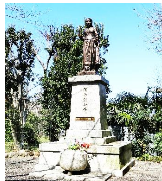
ナイチンゲール像