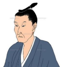
吉田松陰 一日一言