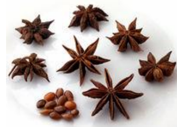
八角の果実と種子

「漢方薬」の原料となる生薬は、植物・動物・鉱物など多岐にわたり国内では 200 数十種類が使われています。その中で、約 150 種類が保険適用になっています。因みに、私達の身近なものではドクダミ、ゲンノシヨウコ、センブリなどがあります。新薬の開発にも使われ、インフルエンザ治療薬“タミフル”の原料成分のシキミ酸は生薬やスパイスとして知られる