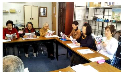
歌う会の楽しい様子