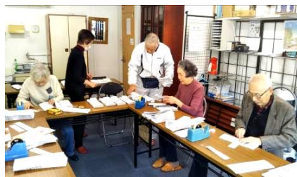
会報仕分けの様子