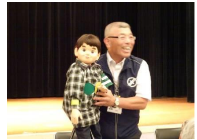
宝塚市職員の腹話術