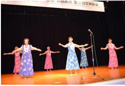
フラ体操の皆さん