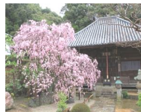
満願寺の枝垂れ桜