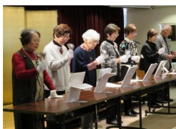
ハンドベルの皆さん