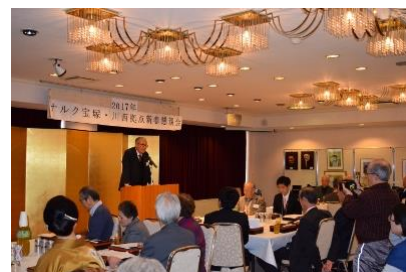
平塚代表挨拶と会場風景