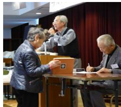
オークション光景